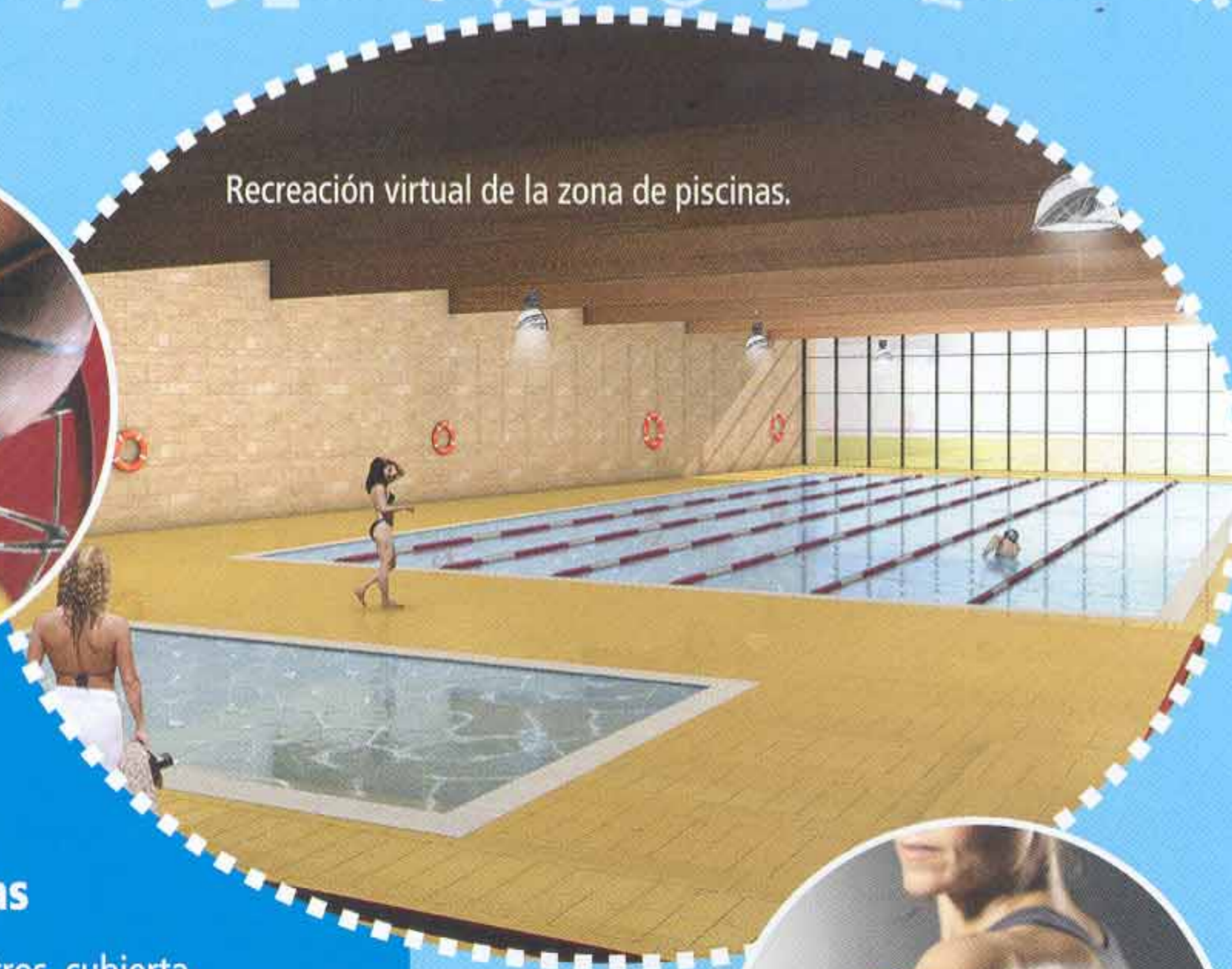
Recreación virtual de la zona de piscinas.